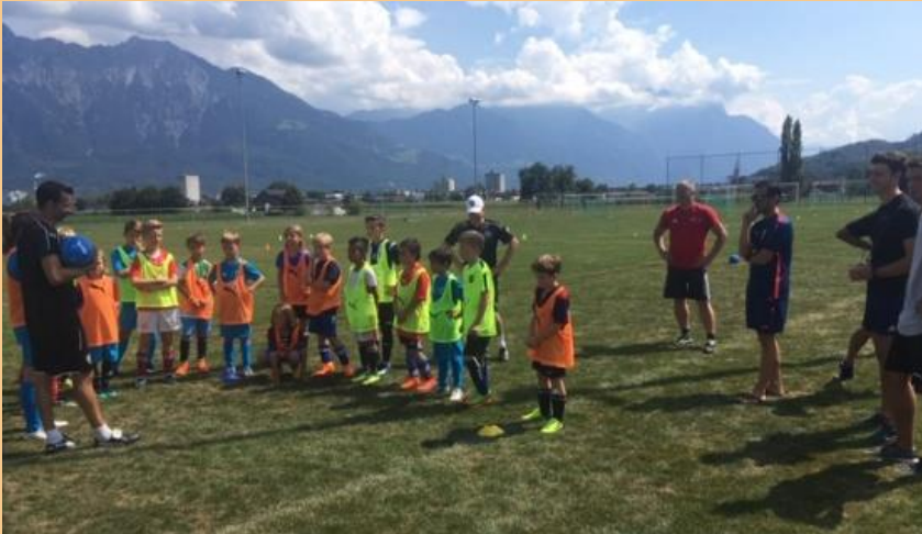
Spielmacher-Kickoff mit den E-Junioren

Rechtzeitig zum Start der neuen Saison wurden alle Trainer zur Einführung des neuen Spielmacher-Konzeptes ( www.spiel-macher.ch ) eingeladen. In einem Theorie- und Praxisteil wurden die wesentlichen Elemente des Konzeptes vorgestellt. Die Reaktionen und die Mitarbeit der Trainer war bisher durchwegs positiv und ich bin der festen Überzeugung, dass dieser neue Leitfaden langfristig die ganze Juniorenabteilung weiterbringt.