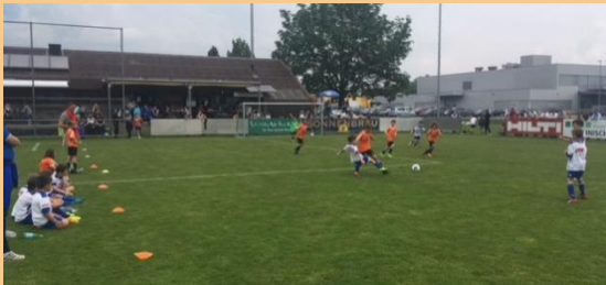
F1-Junioren am Heimturnier in Grabs