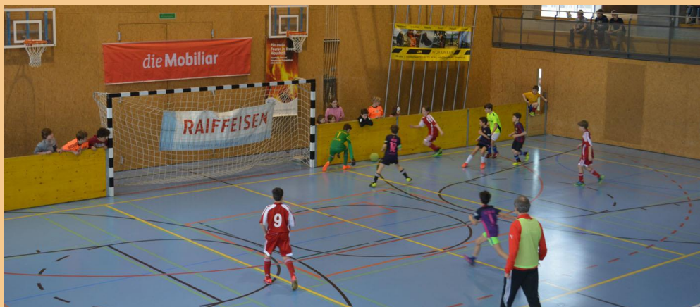
Schülerhallenturnier anfangs März